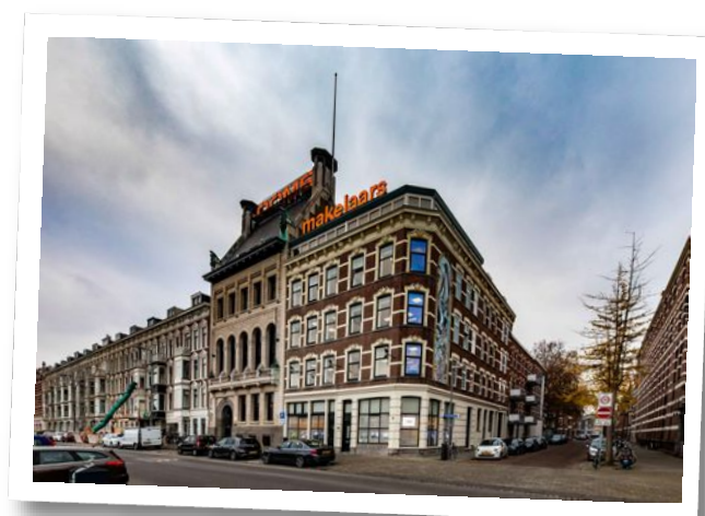
Maaskade 113, 3071 NJ Rotterdam

Informatie aanvragen of bezichtiging plannen? Bel: 010 - 424 8 888