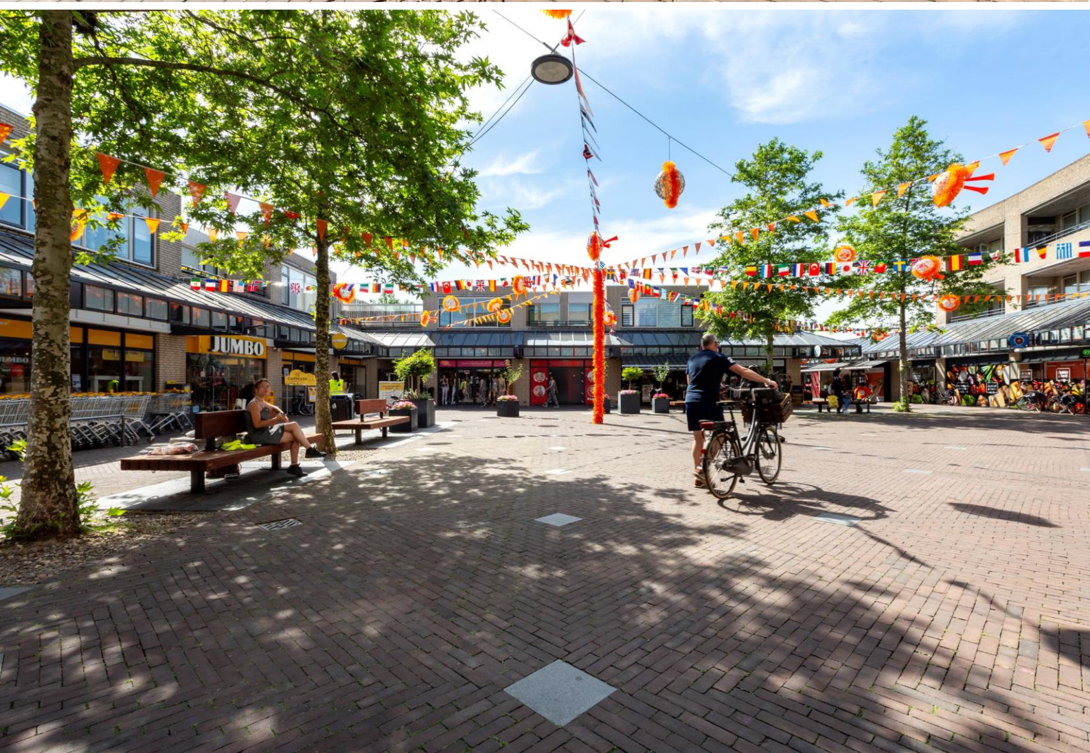
Winkelcentrum Brouwhorst te Helmond