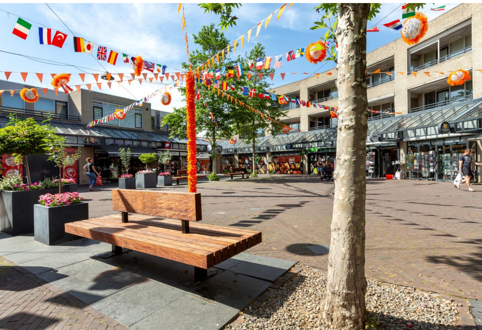
Winkelcentrum Brouwhorst te Helmond