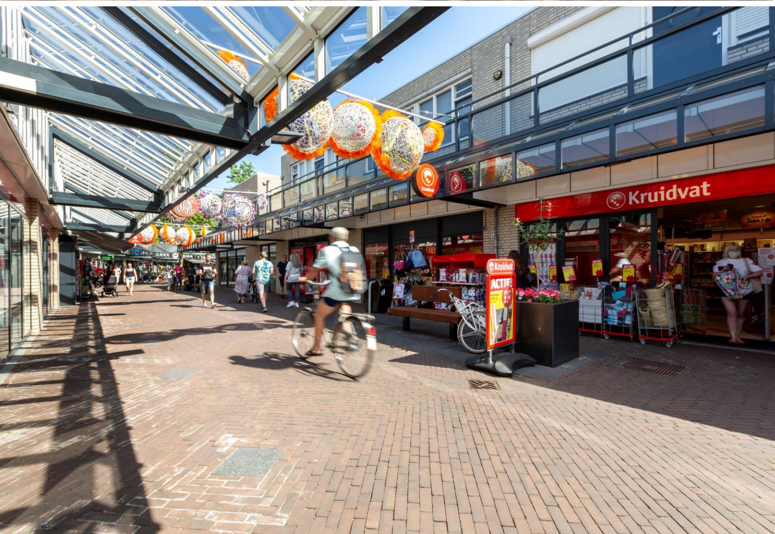
Winkelcentrum Brouwhorst te Helmond