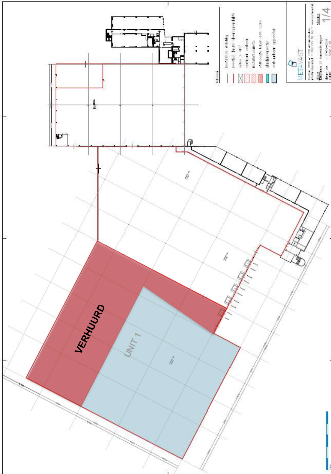
Warehouse I: nog slechts 1.725 m 2 VVO bedrijfsruimte beschikbaar