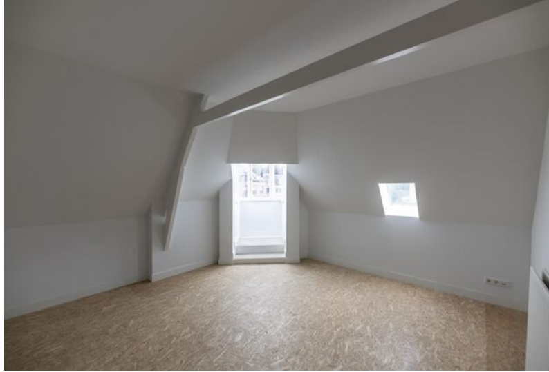
Foto's tweede verdieping