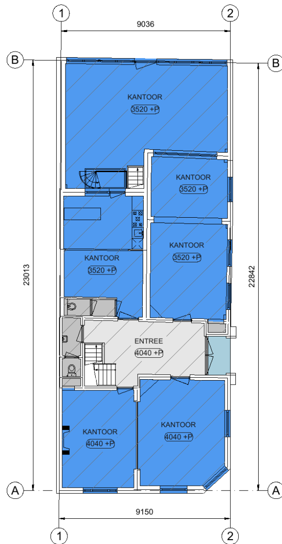
Baronielaan 1, Breda Begane grond