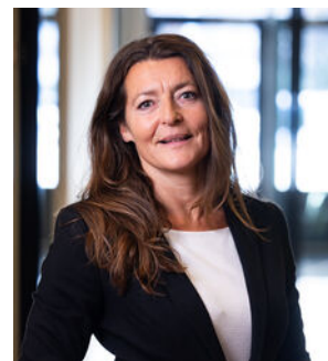
Ellis Kersten Bedrijfsmakelaar Deventer